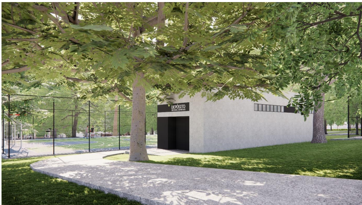
Perspectivas Bloco Vestiário Parque Esportivo, Boa Vista, Garanhuns – PE produzidas pelo autor do projeto arquitetônico, 2025.