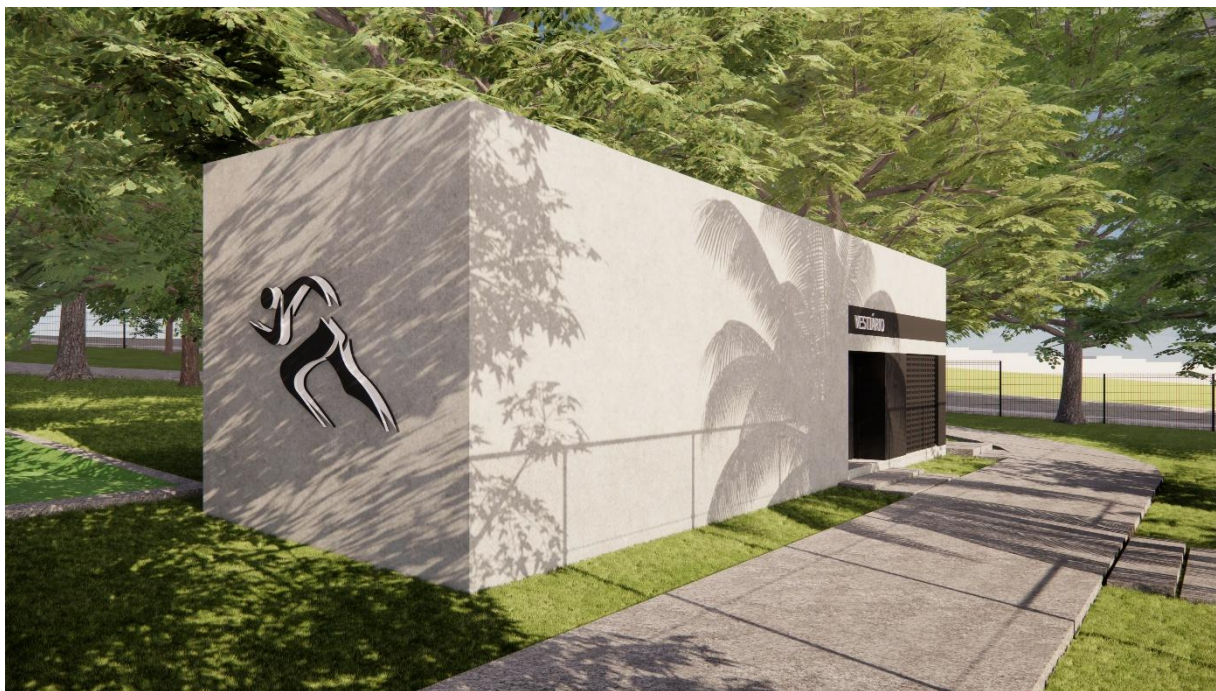
Perspectivas Bloco Vestiário Parque Esportivo, Boa Vista, Garanhuns – PE produzidas pelo autor do projeto arquitetônico, 2025.

Ayrton Bruno da Silva Teixeira Arquiteto e Urbanista CAU Nº 1789453-6