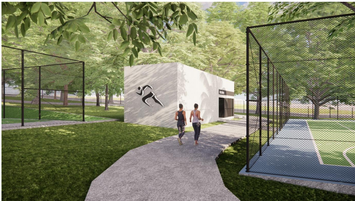
Perspectivas Bloco Vestiário Parque Esportivo, Boa Vista, Garanhuns – PE produzidas pelo autor do projeto arquitetônico, 2025.