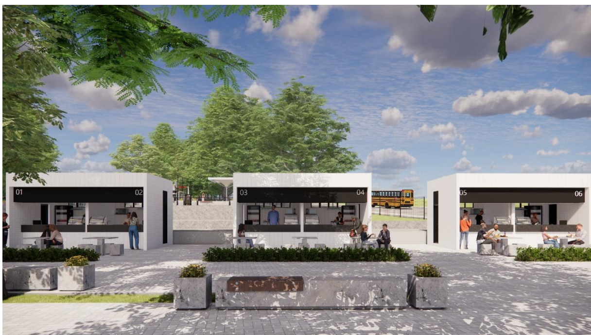
Perspectivas Quiosques Parque Esportivo, Boa Vista, Garanhuns – PE produzidas pelo autor do projeto arquitetônico, 2025

Ayrton Bruno da Silva Teixeira Arquiteto e Urbanista CAU Nº 189453-6