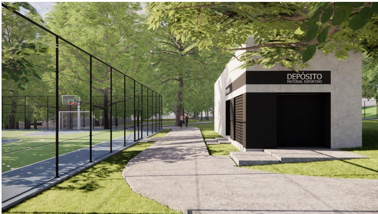
Perspectivas Bloco Vestiário Parque Esportivo, Boa Vista, Garanhuns – PE produzidas pelo autor do projeto arquitetônico, 2025.