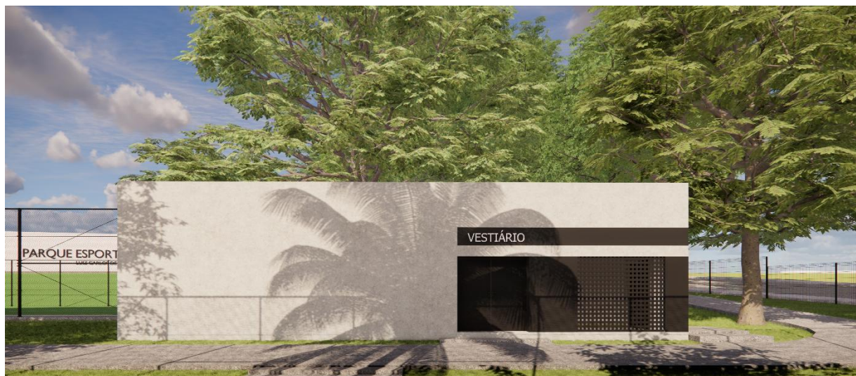
Perspectivas Bloco Vestiário Parque Esportivo, Boa Vista, Garanhuns – PE produzidas pelo autor do projeto arquitetônico, 2025.