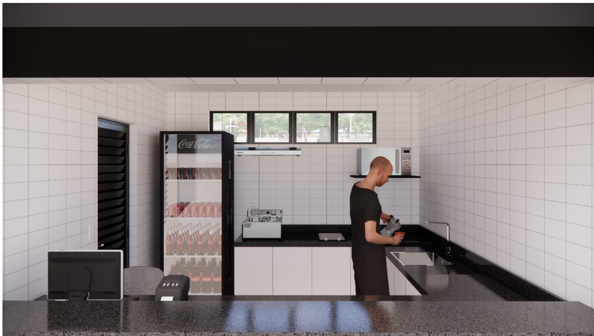
Perspectivas Quiosques Parque Esportivo, Boa Vista, Garanhuns – PE produzidas pelo autor do projeto arquitetônico, 2025.