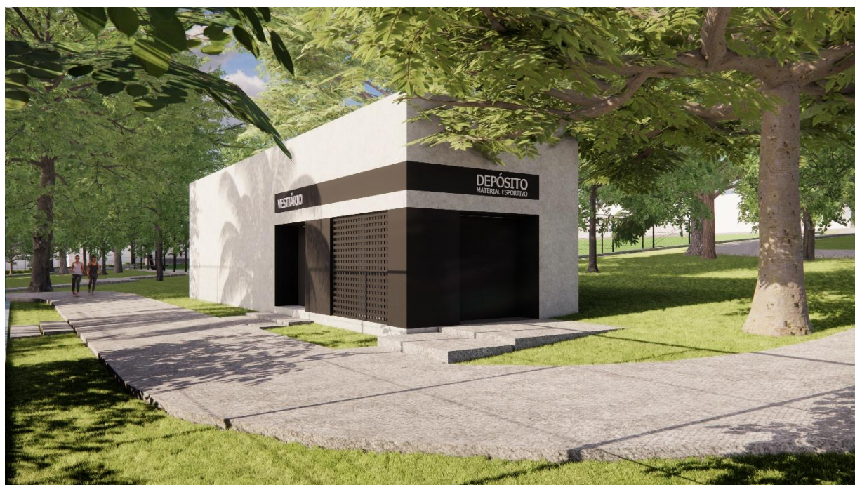
Perspectivas Bloco Vestiário Parque Esportivo, Boa Vista, Garanhuns – PE produzidas pelo autor do projeto arquitetônico, 2025.

Ayrton Bruno da Silva Teixeira Arquiteto e Urbanista CAU Nº 189453-6