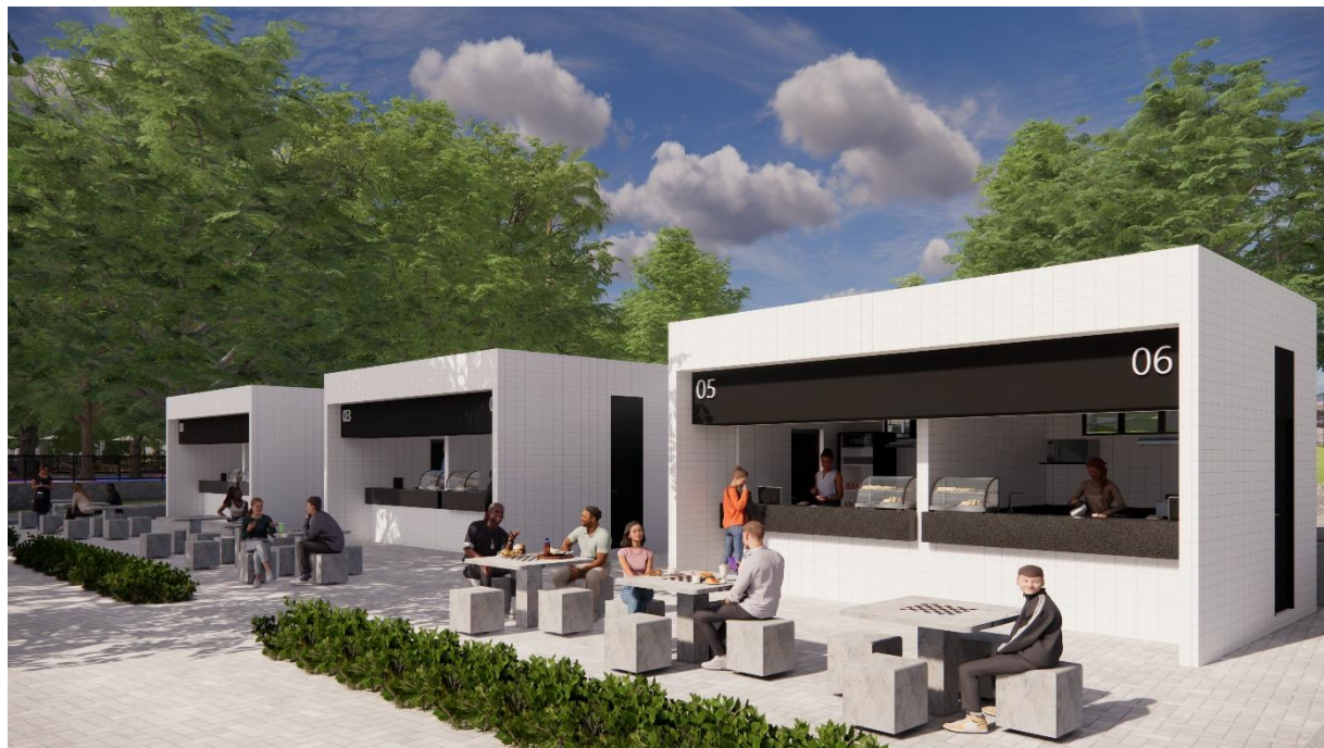
Perspectivas Quiosques Parque Esportivo, Boa Vista, Garanhuns – PE produzidas pelo autor do projeto arquitetônico, 2025.