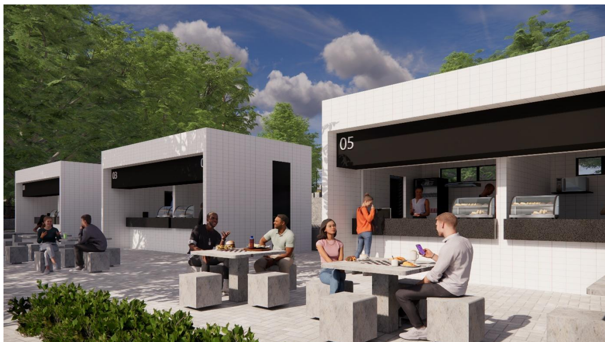
Perspectivas Quiosques Parque Esportivo, Boa Vista, Garanhuns – PE produzidas pelo autor do projeto arquitetônico, 2025.

Ayrton Bruno da Silva Teixeira Arquiteto e Urbanista CAU Nº 1489453-6