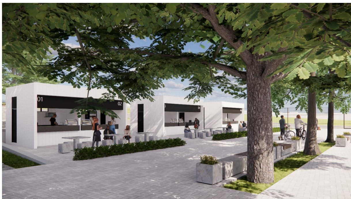
Perspectivas Quiosques Parque Esportivo, Boa Vista, Garanhuns – PE produzidas pelo autor do projeto arquitetônico, 2025.

Ayrton Bruno da Silva Teixeira Arquiteto Urbanista CAU Nº 189453-6