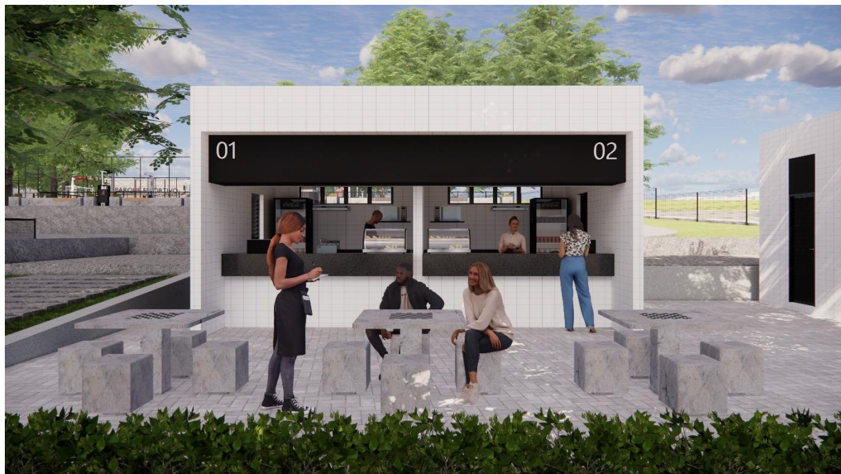
Perspectivas Quiosques Parque Esportivo, Boa Vista, Garanhuns – PE produzidas pelo autor do projeto arquitetônico, 2025.