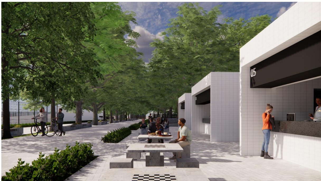
Perspectivas Quiosques Parque Esportivo, Boa Vista, Garanhuns – PE produzidas pelo autor do projeto arquitetônico, 2025.