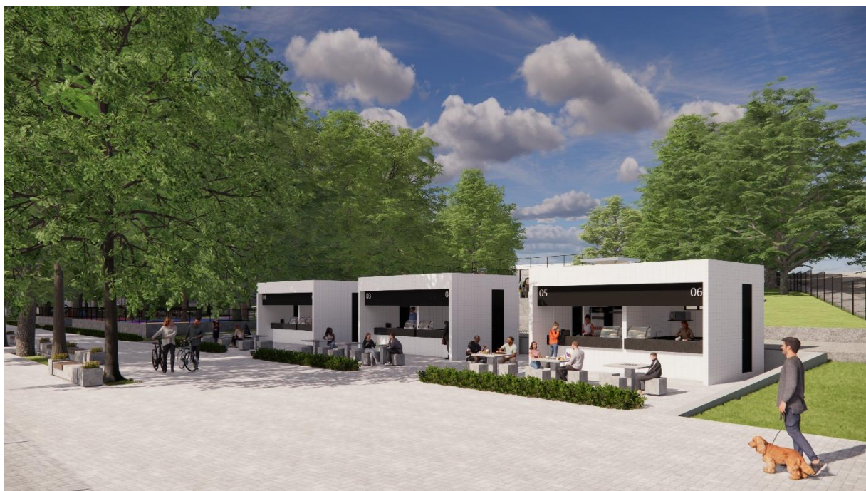
Perspectivas Quiosques Parque Esportivo, Boa Vista, Garanhuns – PE produzidas pelo autor do projeto arquitetônico, 2025.

O presente Memorial Descritivo estabelece as condições e especificações técnicas que deverão ser obedecidas para a execução dos serviços referentes ao projeto arquitetônico de ampliação do Parque Esportivo Luiz Carlos de Oliveira, no Bairro Boa Vista, na cidade de Garanhuns – PE.